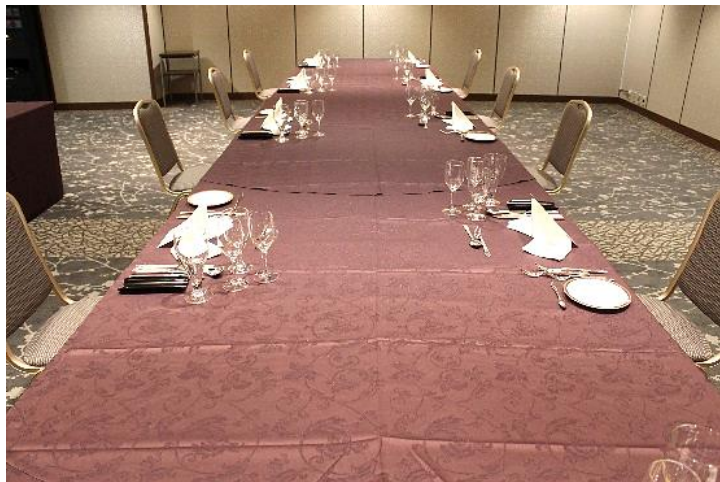
白鳥の間対面形式（ソーシャルディスタンス）