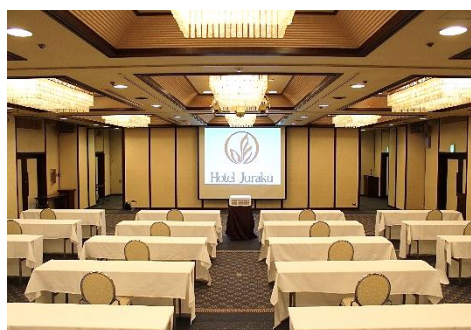
孔雀の間スクール形式（1名掛け）