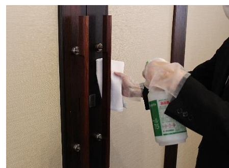
ご利用毎に消毒をしております