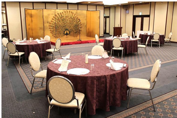
孔雀の間円卓形式（4名掛け）